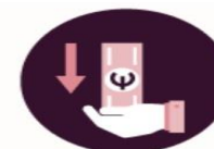
Pervedimas į savo sąskaitą